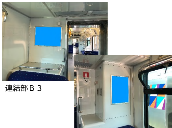
連結部 B 3