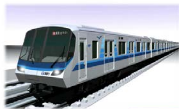
1 車両外観図・内観図